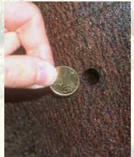
Trous d'émergence